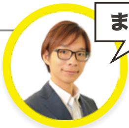
中小企業庁ミラサポ 認定専門家 株式会社 muku. 代表取締役